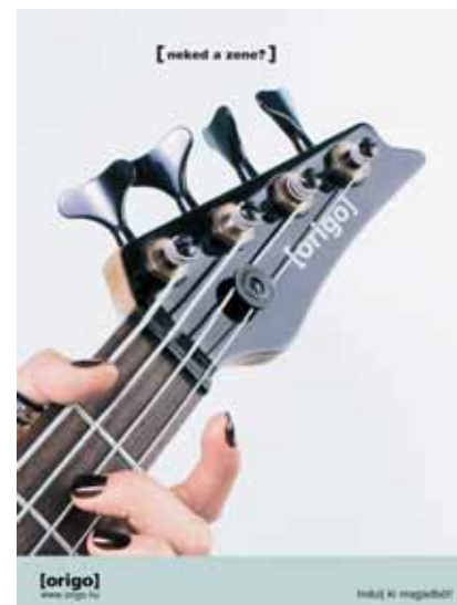
Termék: [origo] Alkotó: Publicis Reklámügynökség